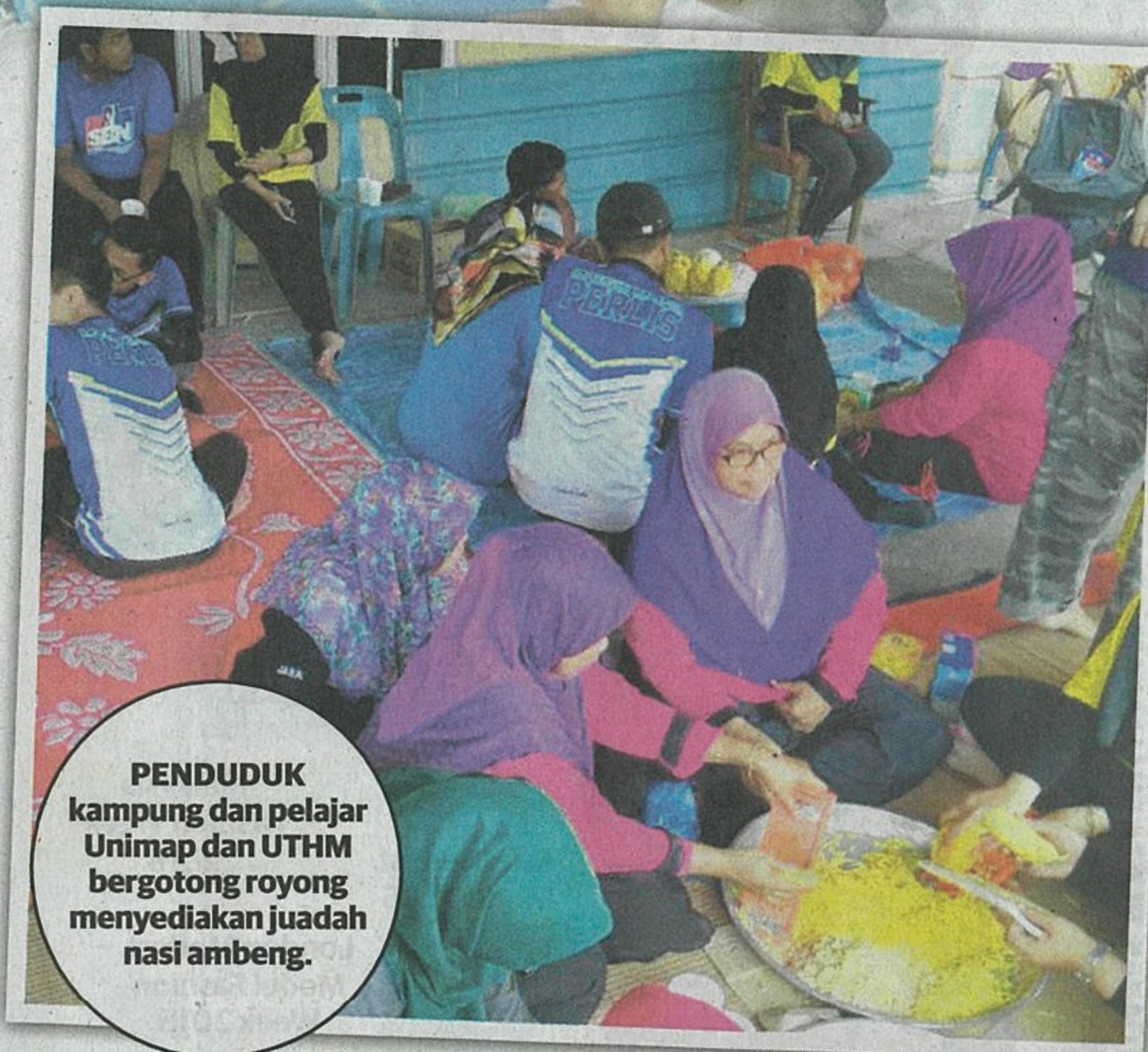
PENDUDUK kampung dan pelajar Unimap dan UTHM bergotong royong menyediakan juadah nasi ambeng.

SEBAHAGIAN penduduk Kampung Parit Raja, Batu Pahat, Johor, menjamu juadah nasi ambeng yang disediakan oleh pelajar Unimap dan UTHM di Surau Al-Ehsan Kampung Parit Raja, Batu Pahat, Johor baru-baru ini.