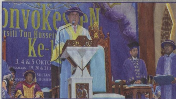
SULTAN Johor, Sultan Ibrahim Sultan Iskandar selaku Canselor Universiti Tun Hussein Onn Malaysia (UTHM) ketika beritiah merasmikan Majlis Konvokesyen UTHM di Batu Pahat, Johor, baru-baru ini.