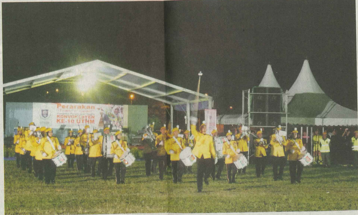
BRASS Band Rela Zon Selatan turut mengadakan persembahan di Batu Pahat, baru-baru ini.

➤ BAGAIKAN pesta, pertunjukan bunga api memeriahkan perarakan Town n Gown di Batu Pahat, baru-baru ini.