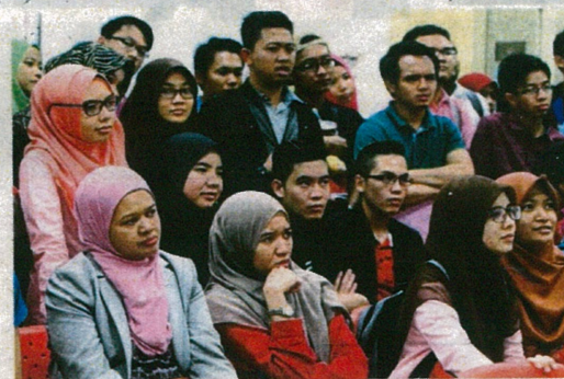
Sebahagian pelajar hadir pada Pertandingan Debat Perdana Gender 2015 peringkat suku akhir di Pusat Asasi Sains, UM.