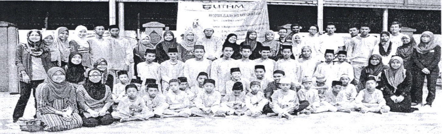
(atas) PELAJAR UTHM berkesempatan mengabadikan gambar kenangan bersama anak-anak yatim. (kanan) SISWI UTHM tersenyum gembira menyediakan juadah berbuka untuk anak-anak yatim.