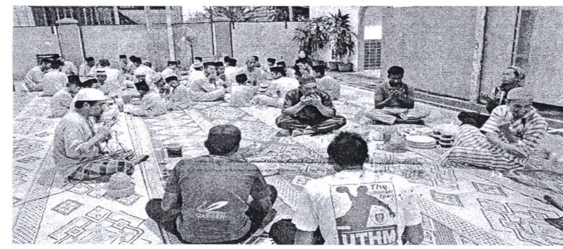
BERBUKA bersama anak-anak yatim di Rumah Anak Yatim Ar-Raudhoh.

negara," katanya. Pelajar memulakan aktiviti di Rumah Anak Yatim dengan menyediakan juadah berbuka puasa dan bersahur, memberikan kaunseling kepada anak yatim serta menyampaikan sumbangan kepada pengelola dan anak-anak yatim. Di Kg Karamunting Sandakan pula, pelajar memulakan program dengan mengadakan gotong royong membersihkan kawasan masjid, mengadakan program keluarga angkat dan menyediakan bubur lambuk sebagai juadah berbuka puasa. Pelajar juga berkesempatan melawat Semporna bagi melihat keadaan sebenar daerah itu yang merupakan produk pelancongan negeri sabah. Di samping itu, pelajar juga dapat melawat Kg Inderasabah yang