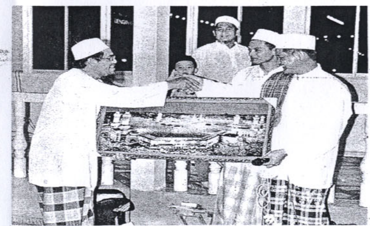
AKBAL menerima cendera kenangan daripada pengerusi Masjid Kg Karamunting.

dapat melahirkan UTHM sebagai IPTA yang prihatin terhadap kedaulatan