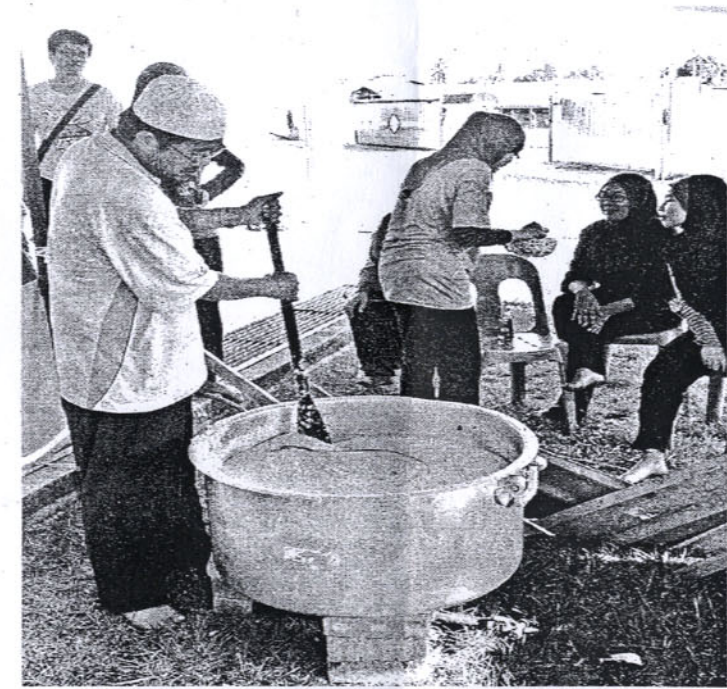
AKBAL memasak bubur lambuk di Kg Karamunting, Sandakan.

negara," katanya. Pelajar memulakan aktiviti di Rumah Anak Yatim dengan menyediakan juadah berbuka puasa dan bersahur, memberikan kaunseling kepada anak yatim serta menyampaikan sumbangan kepada pengelola dan anak-anak yatim. Di Kg Karamunting Sandakan pula, pelajar memulakan program dengan mengadakan gotong royong membersihkan kawasan masjid, mengadakan program keluarga angkat dan menyediakan bubur lambuk sebagai juadah berbuka puasa. Pelajar juga berkesempatan melawat Semporna bagi melihat keadaan sebenar daerah itu yang merupakan produk pelancongan negeri sabah. Di samping itu, pelajar juga dapat melawat Kg Inderasabah yang