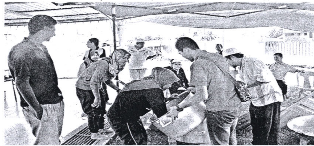
PELAJAR UTHM bergotong-royong memasak bubur lambuk di Kg Karamunting.

S ERAMAI 28 pelajar termasuk pensyarah daripada Universiti Tun Hussein Onn Malaysia (UTHM) menjayakan program 'Jelajah Ihya Ramadan Sabah' pada 2 hingga 8 Julai lepas. Pelajar terlibat merupakan pelajar Seksyen 5, UWS 10303-Kenegaraan daripada Fakulti Sains, Teknologi dan Pembangunan Insan. Program itu dijalankan di beberapa tempat terpilih, antaranya Rumah Anak Yatim Ar-Raudhoh