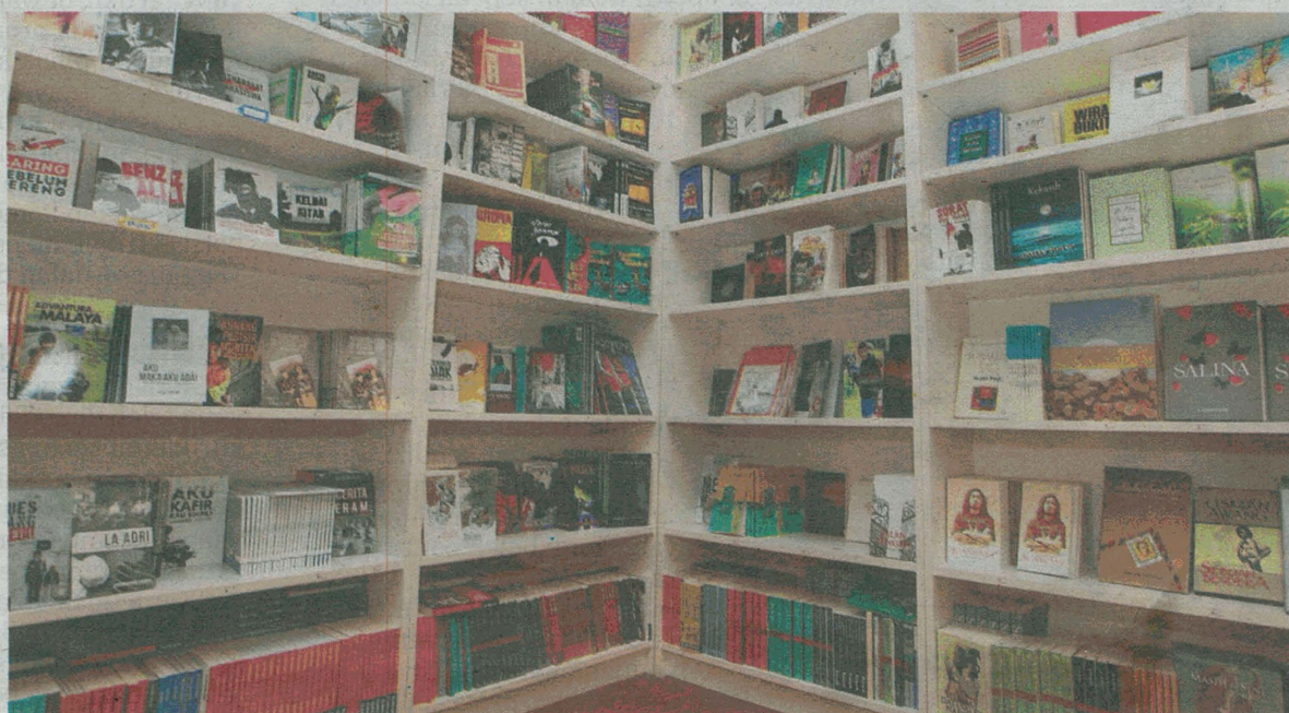
SEBAHAGIAN daripada buku terbitan Lejen Press yang dipamerkan di kedai buku Lejen di Subang Jaya, Selangor.