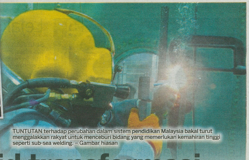
TUNTUTAN terhadap perubahan dalam sistem pendidikan Malaysia bakal turut menggalakkan rakyat untuk menceburi bidang yang memerlukan kemahiran tinggi seperti sub-sea welding. - Gambar hiasan