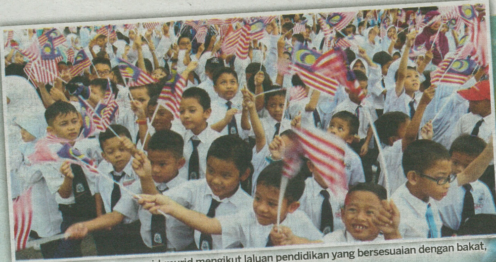
KPM telah menyediakan murid-murid mengikut laluan pendidikan yang bersesuaian dengan bakat, minat dan gaya pembelajaran masing-masing. - Gambar hiasan