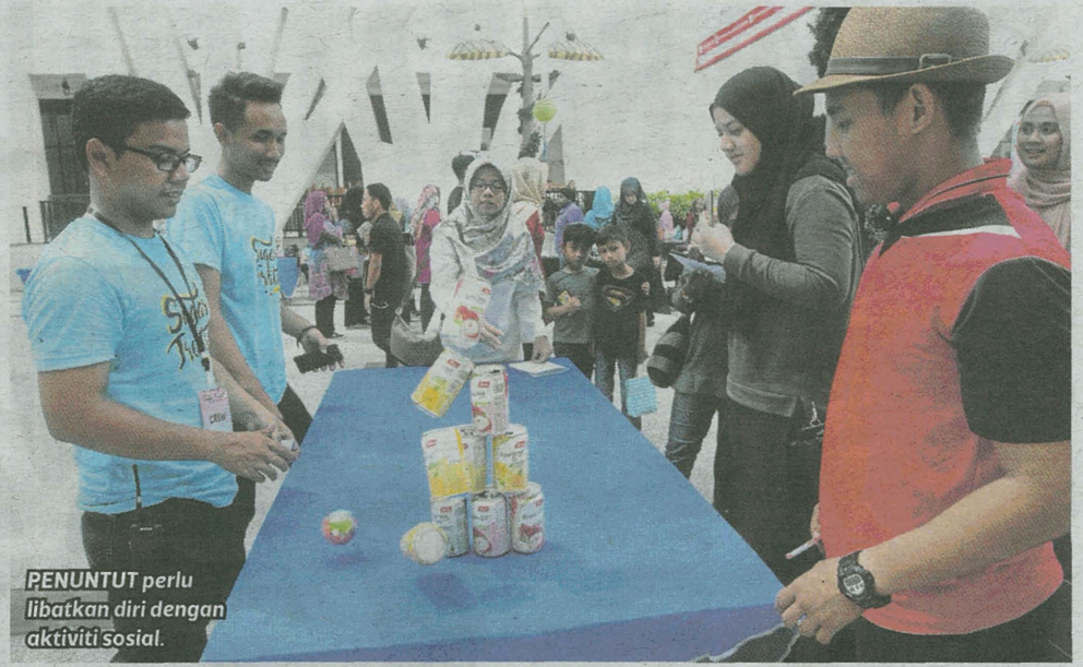
PENUNTUT perlu melibatkan diri dengan aktiviti sosial.

Apabila desakan gred semata-mata jadi kegilaan maka wujud generasi kosong tanpa akal budi