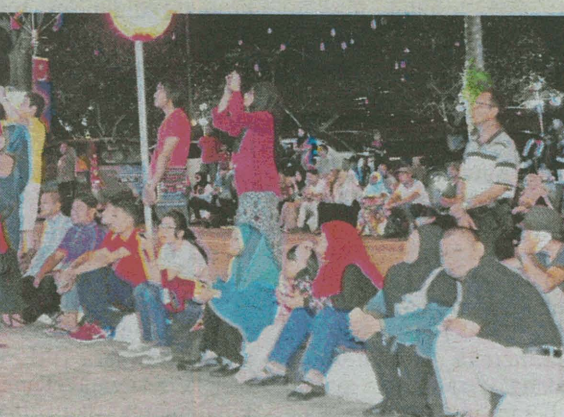
ORANG ramai melihat skrin besar perkahwinan Tunku Tun Aminah di Bangunan MJB.