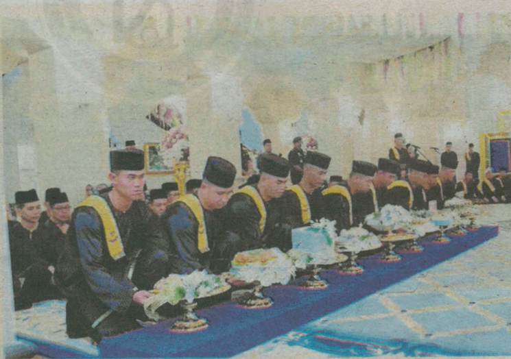
ROMBONGAN membawa dulang hantaran.